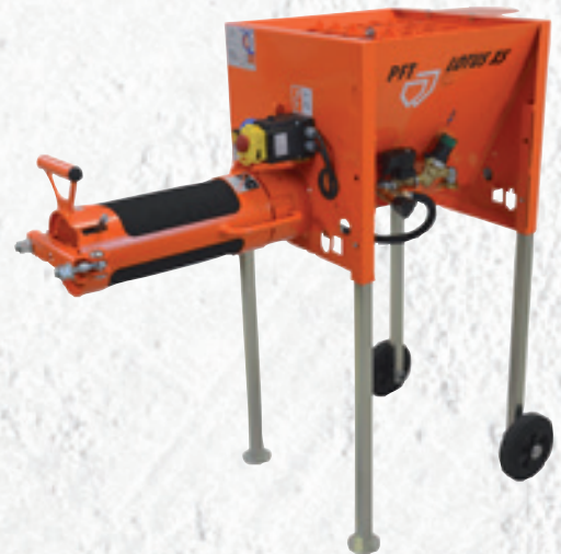
Durchlaufmischer PFT LOTUS XS R Mörtel - mit Gummi-Mischrohr