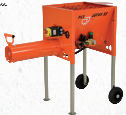
Durchlaufmischer PFT LOTUS XS Mörtel - mit Stahl-Mischrohr