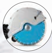
355 mm Sägeblatt mit Schnitttiefe bis 125 mm